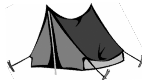
Premières sections d'éclaireuses en France