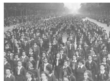
Défilé place de la Concorde