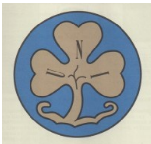
Une section israélite à la FFE