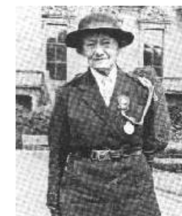
Fondation des Girl-Guides