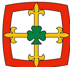
Création de la FEEUF