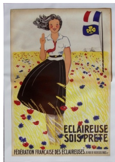
Fondation de la FFE