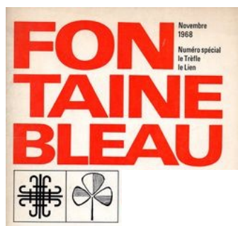
Congrès de Fontainebleau