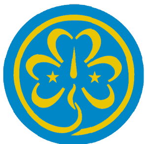
Fondation de l'AMGE